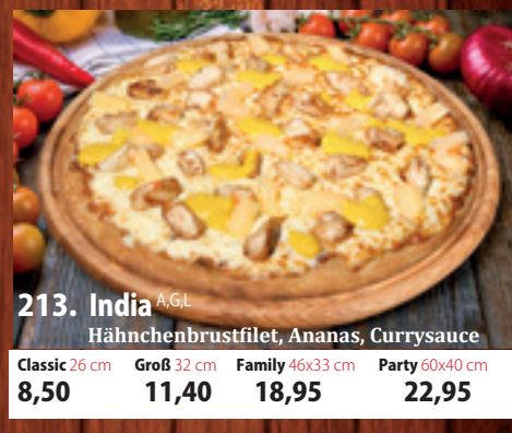
213. India A,GL Hähnchenbrustfilet, Ananas, Currysauce Classic 26 cm 8,50 Groß 32 cm 11,40 Family 46x33 cm 18,95 Party 60x40 cm 22,95