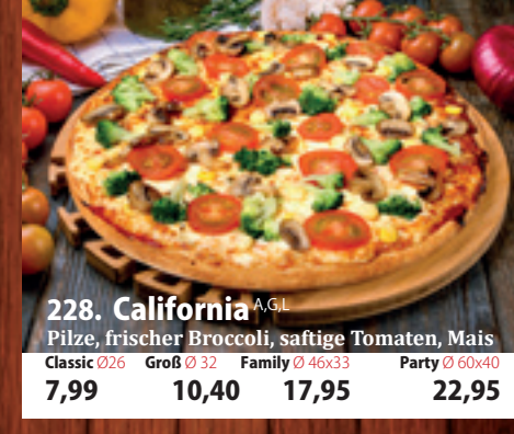
228. California A,GL Pilze, frischer Broccoli, saftige Tomaten, Mais Classic 026 7,99 Groß 032 10,40 Family 46x33 17,95 Party 60x40 22,95