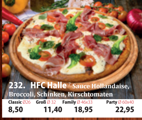
232. HFC Halle 7 Sauce Hollandaise, Broccoli, Schinken, Kirschtomaten Classic 026 8,50 Groß 032 11,40 Family 46x33 18,95 Party 60x40 22,95