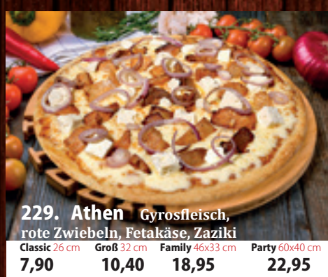
229. Athen A,GL Gyrosfleisch, rote Zwiebeln, Fetakäse, Zaziki Classic 026 7,90 Groß 032 10,40 Family 46x33 cm 18,95 Party 60x40 cm 22,95