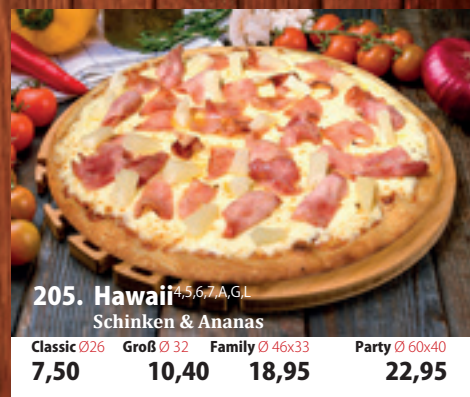
205. Hawaii 4,5,6,7,A,GL Schinken & Ananas Classic 026 7,50 Groß 032 10,40 Family 46x33 18,95 Party 60x40 22,95