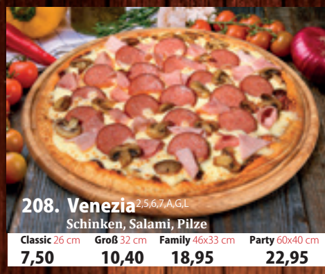
208. Venezia 2,5,6,7,A,GL Schinken, Salami, Pilze Classic 26 cm 7,50 Groß 32 cm 10,40 Family 46x33 cm 18,95 Party 60x40 cm 22,95