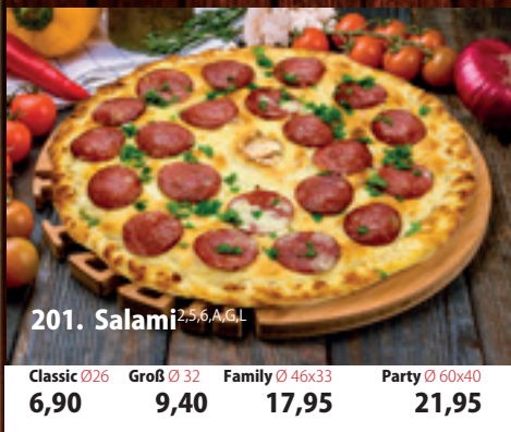
201. Salami 2,5,6,A,GL Classic 026 6,90 Groß 032 9,40 Family 46x33 17,95 Party 60x40 21,95