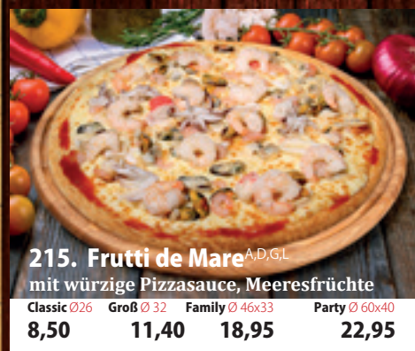
215. Frutti de Mare A,D,GL mit würzige Pizzasauce, Meeresfrüchte Classic 026 8,50 Groß 032 11,40 Family 46x33 18,95 Party 60x40 22,95