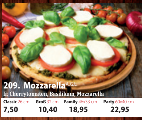
209. Mozzarella A,GL fr. Cherrytomaten, Basilikum, Mozzarella Classic 26 cm 7,50 Groß 32 cm 10,40 Family 46x33 cm 18,95 Party 60x40 cm 22,95