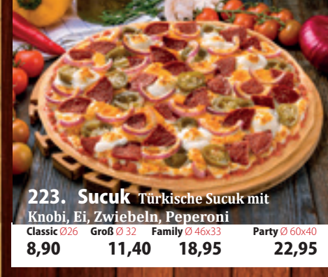
223. Sucuk A,GL Türkische Sucuk mit Knobli, Ei, Zwiebeln, Peperoni Classic 026 8,90 Groß 032 11,40 Family 46x33 18,95 Party 60x40 22,95