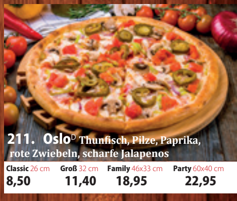
211. Oslo D Thunfisch, Pilze, Paprika, rote Zwiebeln, scharfe Jalapenos Classic 26 cm 8,50 Groß 32 cm 11,40 Family 46x33 cm 18,95 Party 60x40 cm 22,95