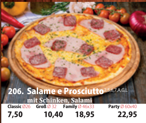
206. Salame e Prosciutto mit Schinken, Salami 4,5,6,7,A,GL Classic 026 7,50 Groß 032 10,40 Family 46x33 18,95 Party 60x40 22,95