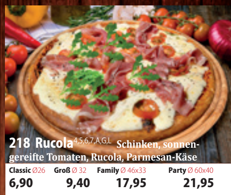
218. Rucola 4,5,6,7,A,GL Schinken, sonnengereifte Tomaten, Rucola, Parmesan-Käse Classic 026 6,90 Groß 032 9,40 Family 46x33 17,95 Party 60x40 21,95