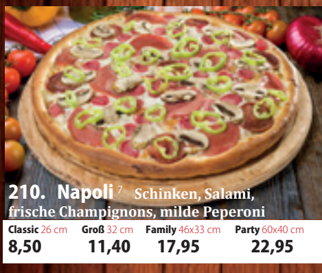
210. Napoli D Schinken, Salami, frische Champignons, milde Peperoni Classic 26 cm 8,50 Groß 32 cm 11,40 Family 46x33 cm 17,95 Party 60x40 cm 22,95