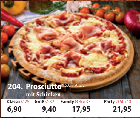
204. Prosciutto mit Schinken 4,5,6,7,A,GL Classic 026 6,90 Groß 032 9,40 Family 46x33 17,95 Party 60x40 21,95