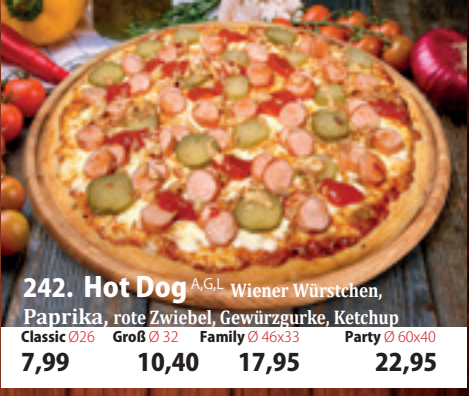
242. Hot Dog A,GL Wiener Würstchen, Paprika, rote Zwiebel, Gewürzgurke, Ketchup Classic 026 7,99 Groß 032 10,40 Family 46x33 17,95 Party 60x40 22,95