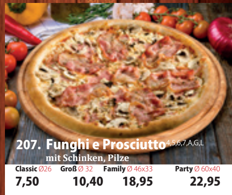
207. Funghi e Prosciutto mit Schinken, Pilze 4,5,6,7,A,GL Classic 026 7,50 Groß 032 10,40 Family 46x33 18,95 Party 60x40 22,95