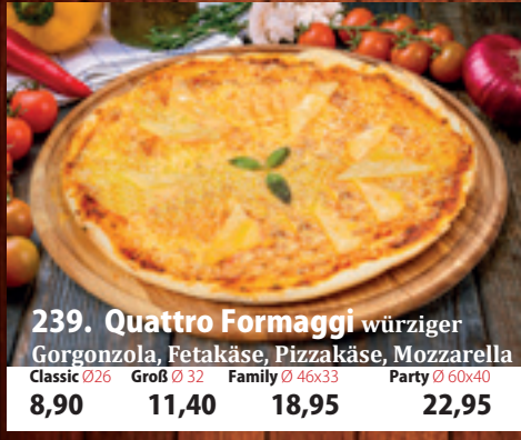
239. Quattro Formaggi A,GL würziger Gorgonzola, Fetakäse, Pizzakäse, Mozzarella Classic 026 8,90 Groß 032 11,40 Family 46x33 18,95 Party 60x40 22,95