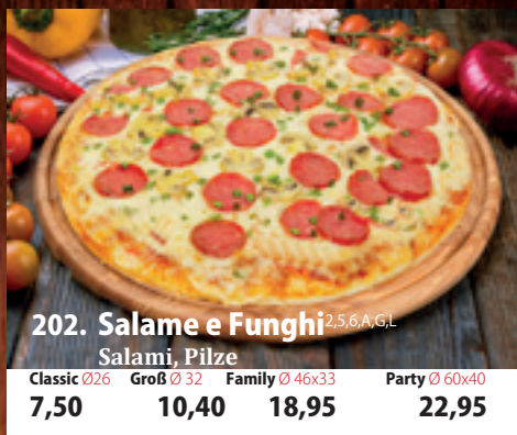
202. Salame e Funghi 2,5,6,A,GL Salami, Pilze Classic 026 7,50 Groß 032 10,40 Family 46x33 18,95 Party 60x40 22,95