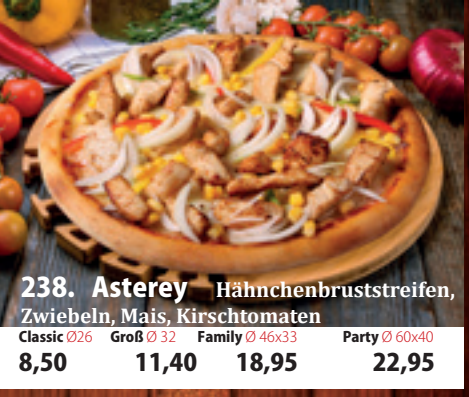
238. Asterey A,GL Hähnchenbruststreifen, Zwiebeln, Mais, Kirschtomaten Classic 026 8,50 Groß 032 11,40 Family 46x33 18,95 Party 60x40 22,95