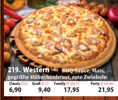
219. Western A,GL BBQ-Sauce, Mais, gegrillte Hähnchenbrust, rote Zwiebeln Classic 026 6,90 Groß 032 9,40 Family 46x33 17,95 Party 60x40 21,95