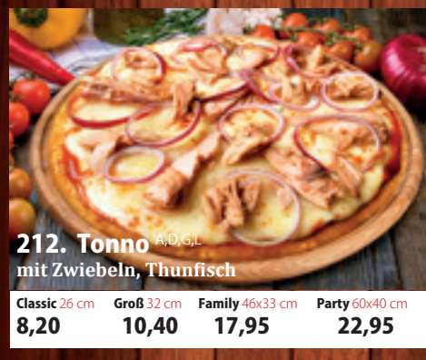
212. Tonno mit Zwiebeln, Thunfisch A,D,GL Classic 26 cm 8,20 Groß 32 cm 10,40 Family 46x33 cm 17,95 Party 60x40 cm 22,95