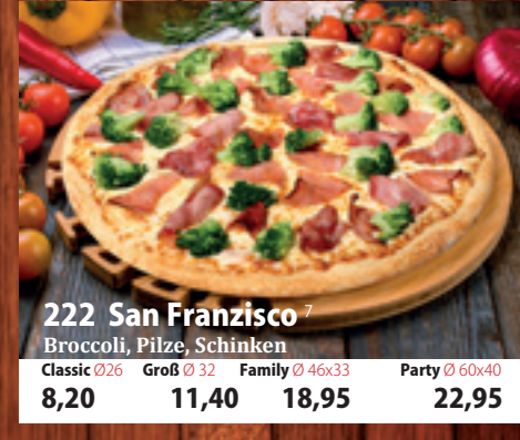
222. San Francisco 7 Broccoli, Pilze, Schinken Classic 026 8,20 Groß 032 11,40 Family 46x33 18,95 Party 60x40 22,95