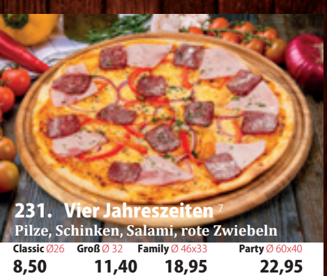
231. Vier Jahreszeiten 7 Pilze, Schinken, Salami, rote Zwiebeln Classic 026 8,50 Groß 032 11,40 Family 46x33 18,95 Party 60x40 22,95